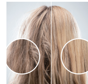
헤어 케어 제품을 사용해도 모발이 쉽게 건조해질 때