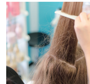
트리트먼트를 사용해도 머리가 엉킬 때