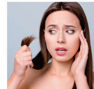
중간중간 갈라지거나 끊어진 모발을 케어하고 싶을 때