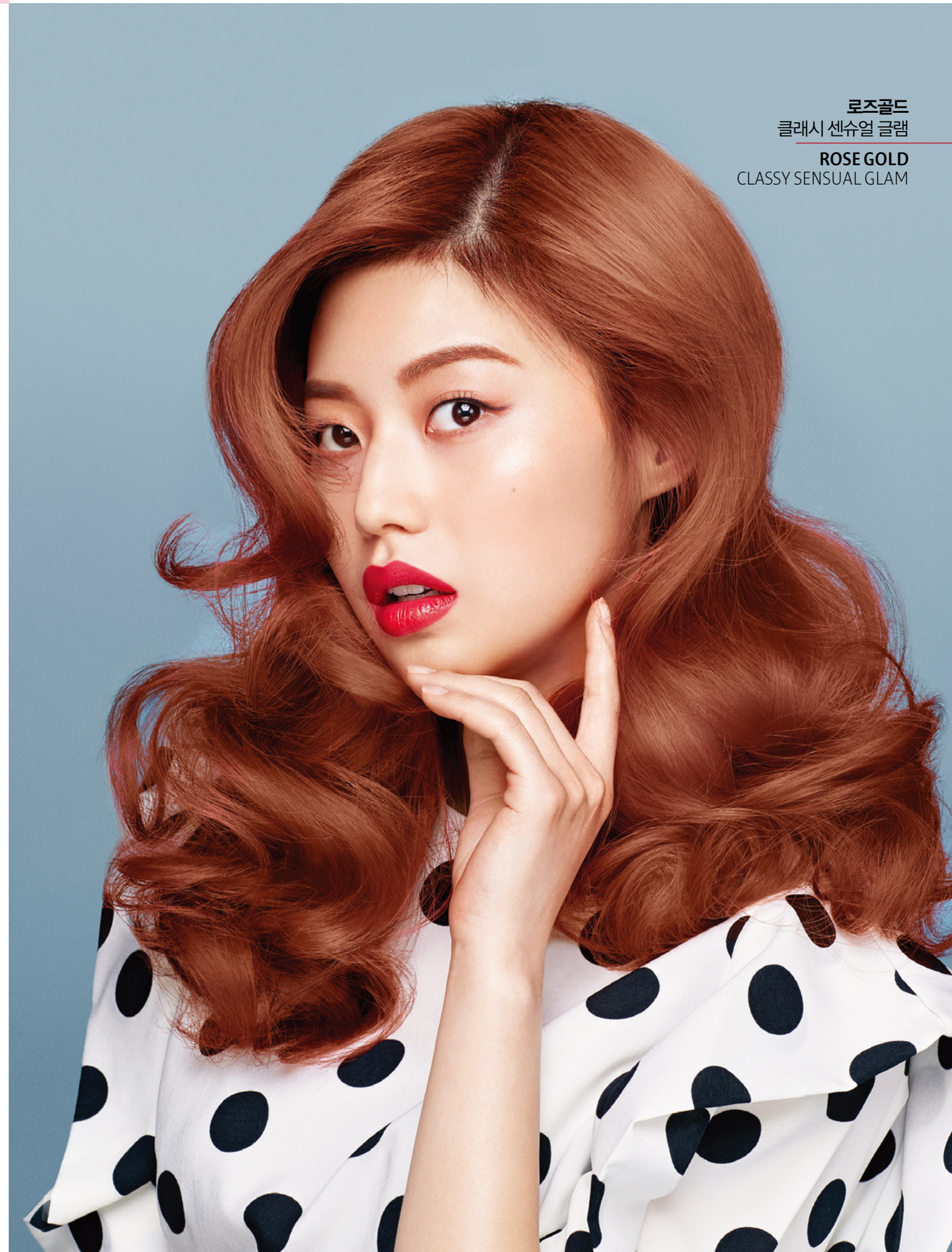
로즈골드 클래시 센슈얼 글램 ROSE GOLD CLASSY SENSUAL GLAM