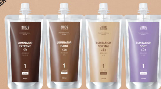
루미네이터 익스트림 (강모용) 루미네이터 하드 (건강모용) 루미네이터 노멀 (보통모용) 루미네이터 소프트 (손상모용)