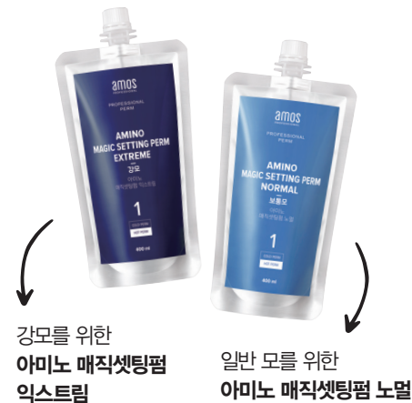
강모를 위한 아미노 매직셋팅폼 익스트림