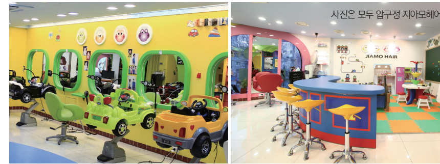
사진은 모두 압구정 지아모헤어